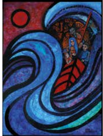
Beate Heinen, Gott mit uns - im Sturm der Zeit, 2020, © ars liturgica Klosterverlag Maria Laach, Nr.3496. www.klosterverlag-maria-laach.de

Klosterverlag Maria Laach Benediktinerabtei 1, 56653 Maria Laach Tel.: 02652/ 59381 Mail: vertrieb@maria-laach.de Web: http://segensreich.de/